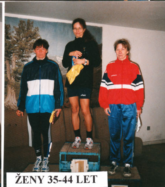
ŽENY 35-44 LET