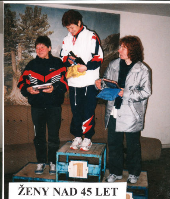
ŽENY NAD 45 LET