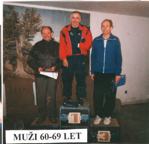
MUŽI 60-69 LET