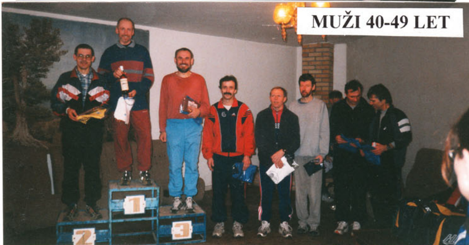
MUŽI 40-49 LET