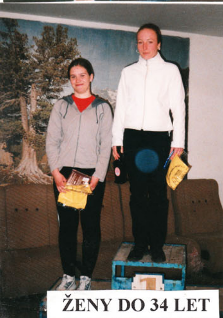
ŽENY DO 34 LET