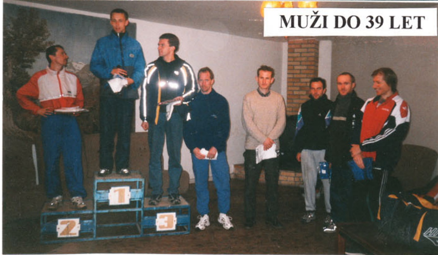
MUŽI DO 39 LET