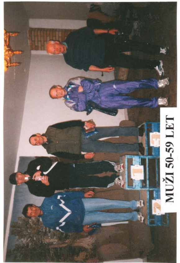
MUŽI 50-59 LET